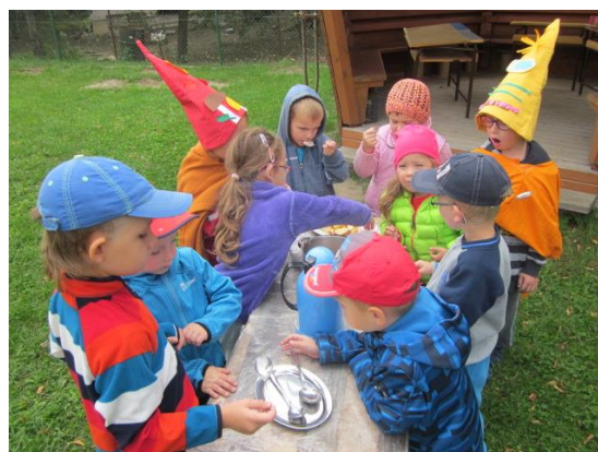
Děti a paní učitelky z MŠ